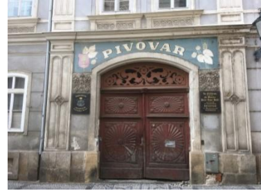
ehemalige Korunní Brauerei, 2002 geschlossen - 2020 mit Kleinbrauerei wiedereröffnet