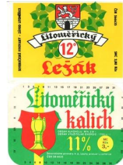
Kleinbrauerei Labut, Radniční Sklípek, Bieretiketten aus Litomerice (vor 1990)