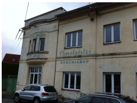
Verwaltungsgebäude Chmelarstvi in Ustek

Übernachtung, Anreise, Essen, Bier, Veranstaltungen gehen selbstredend auf eigene Kosten