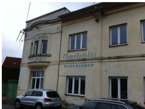
Verwaltungsgebäude Chmelarstvi in Ustek

Übernachtung, Anreise, Essen, Bier, Veranstaltungen gehen selbstredend auf eigene Kosten