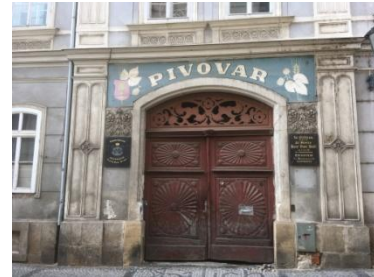
ehemalige Korunni Brauerei, 2002 geschlossen - 2020 mit Kleinbrauerei wiedereröffnet