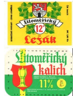
Kleinbrauerei Labut, Radniční Sklipek, Bieretiketten aus Litomerice (vor 1990)