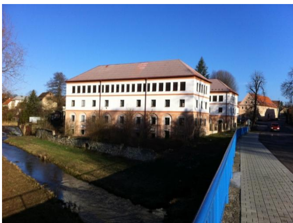
Dreher Brauerei Mecholupy/Michelob