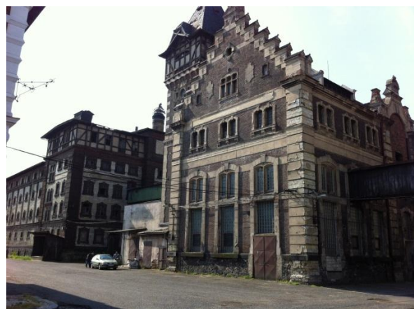
Dreher Brauerei Zatec/Saaz

Wir planen für Sommer 2020 zusammen mit dem Hopfen- und Biertempel Zatec eine Kombination aus Hobbybrauerwettbewerb und kleinem, familiären Beerfest. Selbstgebrautes wird von einem renommierten Biersommelier, einem professionellen Craftbeer-Brauer und von Fachleuten aus der tschechischen Hopfenindustrie probiert, bewertet, ausgezeichnet. Sachpreise gibt es auch (böhmischer Hopfen etc.).